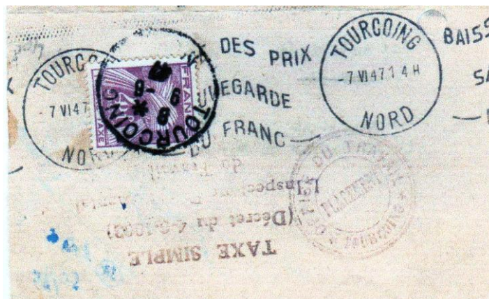
Envoi du 4 juin 1947 en simple taxe affranchie à 4 Francs.

Parmi les documents susceptibles de relever de la simple taxe figurent les avis de non livraison. En effet, la remise de l'avis de non-livraison faisait l'objet d'un traitement en taxe simple depuis le 1 er octobre 1913, en application de la loi de finances du 30 juillet 1913.